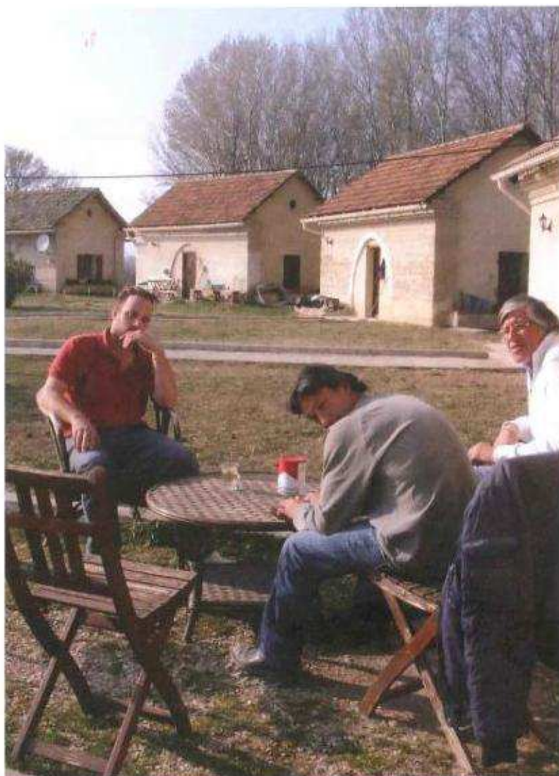
Au Village, chacun fait attention à l'autre.

« C'est la première fois que j'accepte l'autorité. »