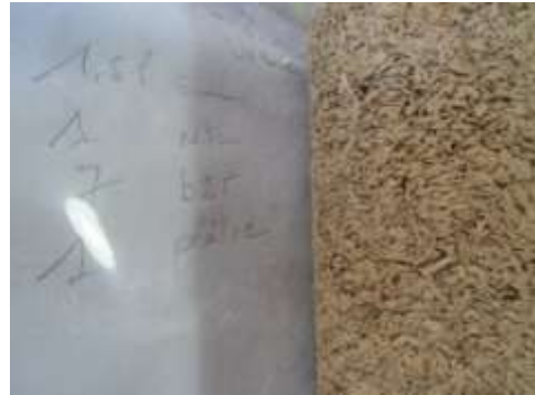
Exemple de cylindre standardisé (plâtre-balle-nite)