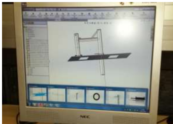
Conception en cours

La presse doit être opérationnelle avant la fin de l'année scolaire 2015-2016, pour pouvoir roder la production au Village dès l'été 2016.