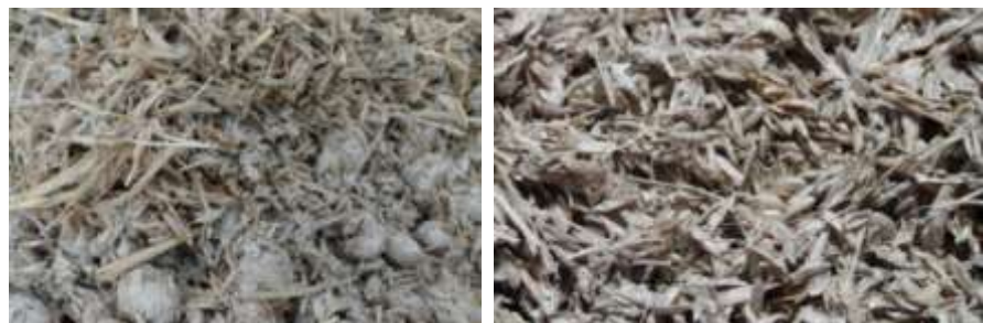
Zoom sur un mélange trop sec (à gauche, boulettes) et un mélange équilibré (à droite)