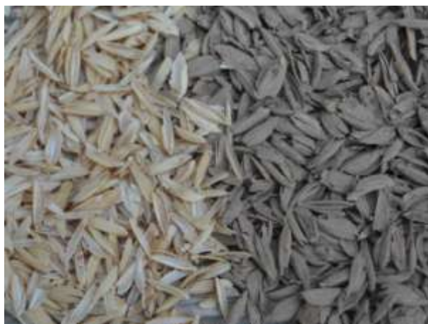
Balle de riz brute (à gauche), chocopops (à droite)

La fabrication du chocopops nécessite aussi le nettoyage de la balle de riz pour éviter que des moisissures ne se forment.