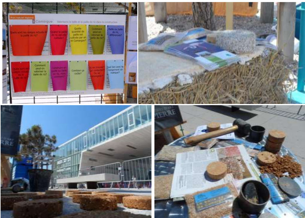
Stand des PNR. Balle et paille de riz. Atelier fabrication presse papier BTC