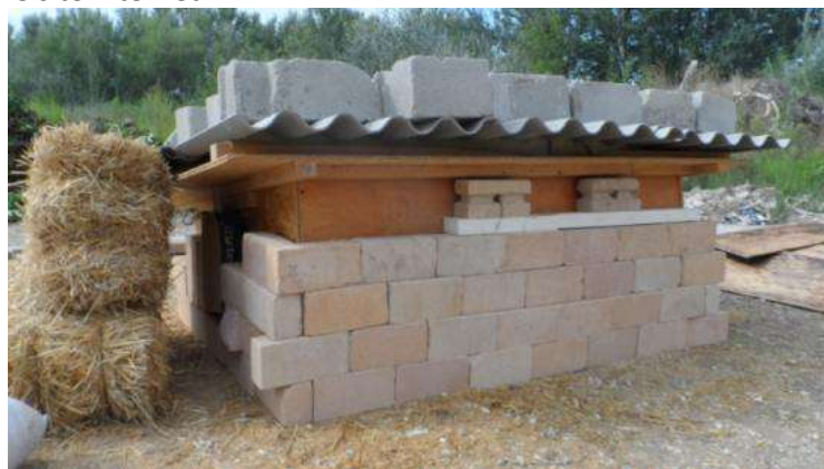
Caisson instrumenté pendant l'essai

Les résultats sont disponibles sur le site internet.