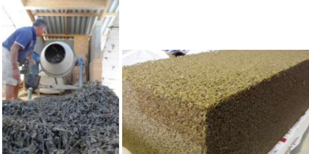
Réalisation des mélanges à la bétonnière (à gauche), brique démoulée (à droite)

Les essais ont donc été poursuivis en fabriquant des briques pour des dosages 1-1 et 1.5-1. Pour un dosage chaux-balle-paille = 1kg-0.85kg-0.85kg, on abouti à une masse volumique proche de 350 kg/m 3 , ce qui a permis d'envisager la fabrication d'un nouveau type de briques isolantes ayant des performances comparables aux briques chaux-chanvre déjà commercialisées (Chanvribloc, Chanvra, ...).