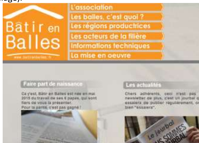
Extrait de la page d’accueil du site internet de « Bâtir en balles »

En 2015, la filière « balle » s’est structurée au travers de la création de « Bâtir en Balles ». (président : Pierre Delot, salarié du Village).