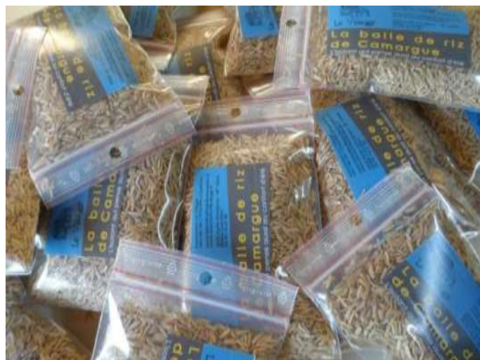
Autocollant et échantillons de balle de riz

1000 sachets zip de balle de riz ont été remplis et sont distribués petit à petit dans les mêmes réseaux que les flyers. Tous les Espaces Info Energie de PACA et LR disposent de quelques sachets.