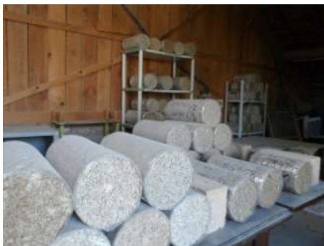
Une partie des éprouvettes standardisées

Ce constat a conduit à un changement de philosophie. D'une logique d'évolution à partir d'une solution existante (chaux-chènevotte), on est passé à une logique nouvelle « chaux-balle-paille ». Là où on trouve de la balle de riz, on trouve de la paille de riz, c'est donc à partir de ces 2 matières premières provenant du même champ qu'il faut travailler pour concevoir des produits. Cette logique est directement duplicable partout là où pousse le riz et permet donc de mutualiser les coûts de développement et de caractérisation. La même logique peut être utilisée pour les autres types de balle (petit épeautre, grand épeautre, ...).