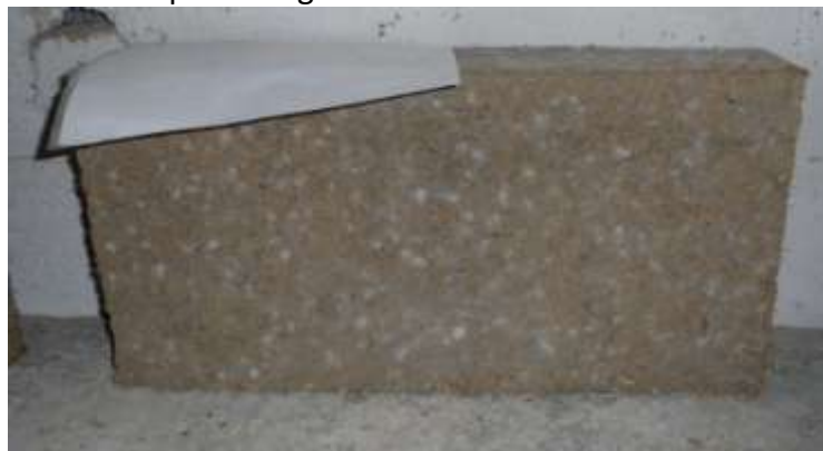
Moisissures à la surface d'une brique faite à partir de balle de riz non tamisée

La mise en œuvre par voie humide nécessite de nettoyer la balle de riz pour enlever les grains restants (brisés ou non). En effet, les grains cassés peuvent fermenter à cause de la présence excessive d'eau. Les grains entiers peuvent germer.