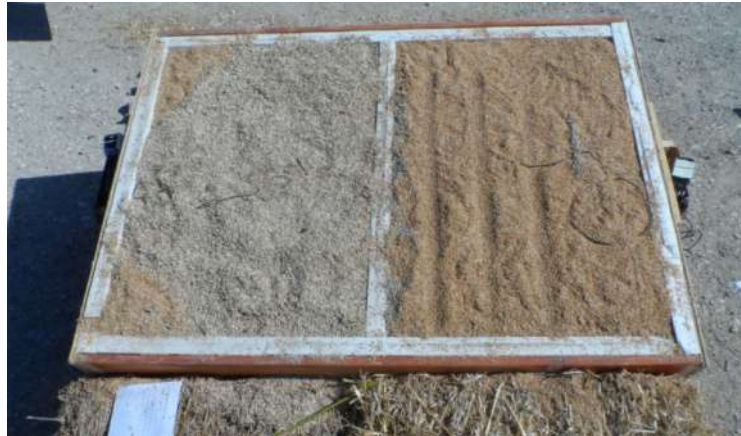
1 caisson, 2 compartiments instrumentés (bale de petit épeautre à gauche, balle de riz à droite)

Ces premiers essais ont permis de confirmer la pertinence des balles vis-à-vis du confort d'été. Ces mesures devront être refaites dans de meilleures conditions en 2016.