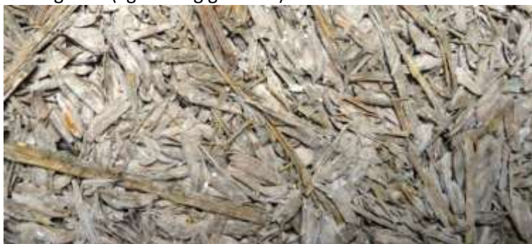
Zoom sur un béton balle de riz - paille de riz broyée

Les essais balle de riz-chènevotte ont été refaits en remplaçant la chènevotte par la paille de riz broyée. Cette paille a la particularité d'être souple et de s'effilocheur quand on la broie. Elle est beaucoup plus efficace que la chènevotte pour alléger les bétons. Il faut remplacer au moins 15% de balle de riz (en masse) par de la paille de riz broyée pour alléger suffisamment les bétons de balle de riz. En dessous de cette proportion, la paille allège peu, mais renforce néanmoins la solidité des bétons. Cette amélioration de la résistance mécanique permet de diminuer la proportion de chaux, ce qui allège d'autant plus les bétons (et donc de les rendre plus performant thermiquement). Les essais donnent de bons résultats en diminuant les proportions de chaux jusqu'à un dosage 1-1 (kg liant-kg granulat).