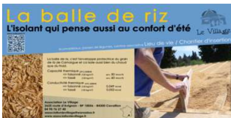
Flyers « balle de riz »

Comme en 2014, des flyers ont été imprimés et sont distribués aux porteurs de projets et aux personnes intéressées par la balle de riz. Les flyers ont été mis à jour.