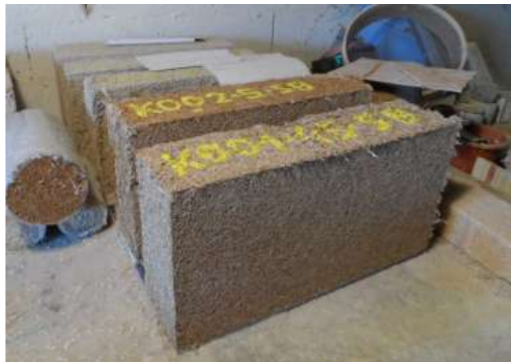
Premières briques faites avec du plâtre Siniat briqueteur (19/11/2015)

La presse à brique isolante en cours de conception est compatible de la fabrication de ces carreaux.