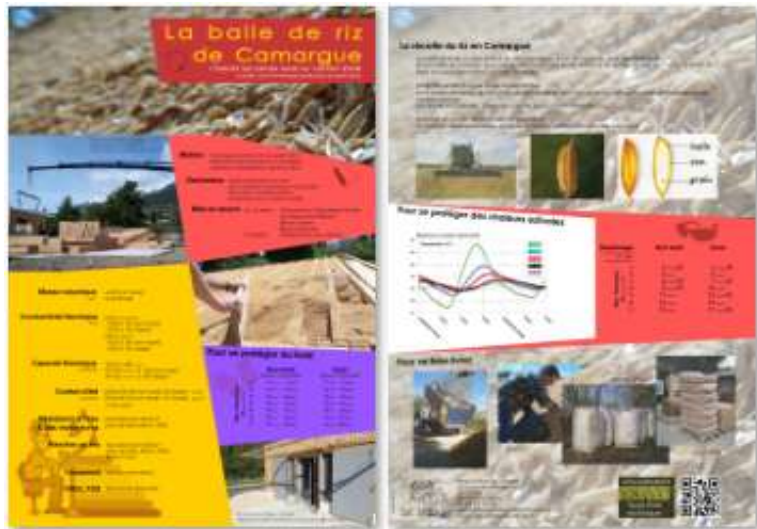
Plaquette A4 recto verso